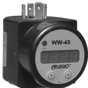
Индикатор PMS-11K (WW-45)